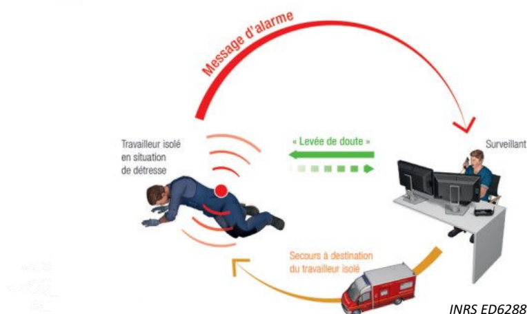
Figure 1. Place du DATI dans la chaîne de secours